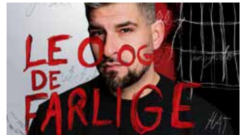
Grafikk: Erika Hebbert / NRK