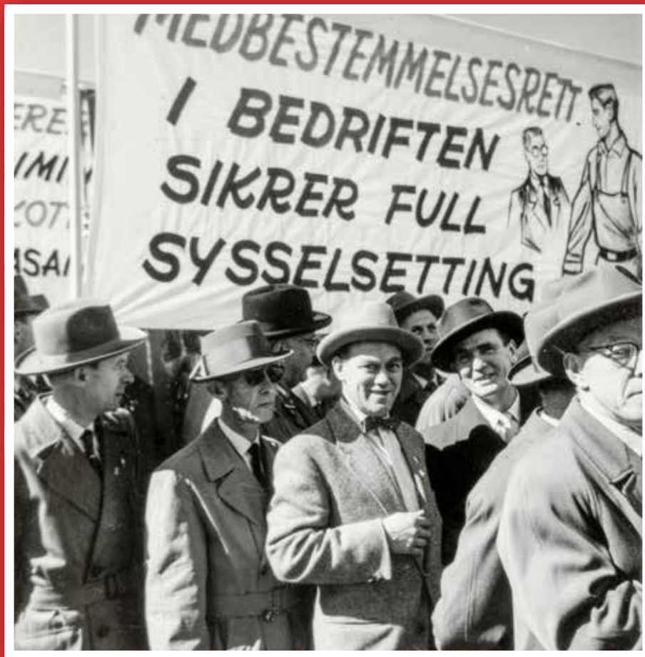
Arstall ukjent.