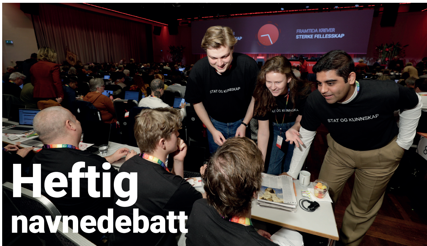
ALLE VIRKEMIDLER: Mange stiller i t-skjorter med teksten «Stat og Kunnskap» i navnedebatten.